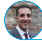
di Igor Marcolongo e di Alberto Nessi

S abato 25 maggio è stata una giornata importante per la nostra Biblioteca Comunale. Durante la Festa della Biblioteca, tradizionale appuntamento conclusivo del "Progetto Lettura" e dei Laboratori di Lettura realizzati durante l'anno con le scuole Don Bosco Facciolati, è stato inaugurato il Centro Torregli@ e sono stati presentati i nuovi servizi della Biblioteca Comunale.